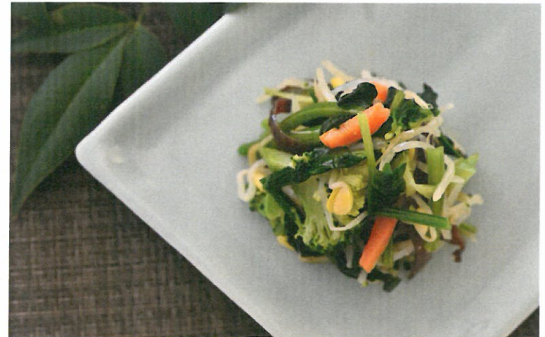
黒キクラゲを使った和え物