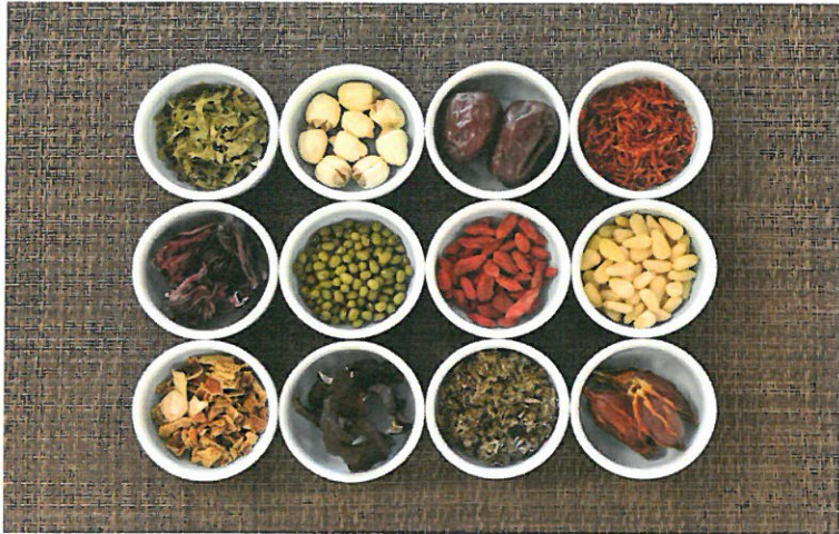
調理に使用する生薬