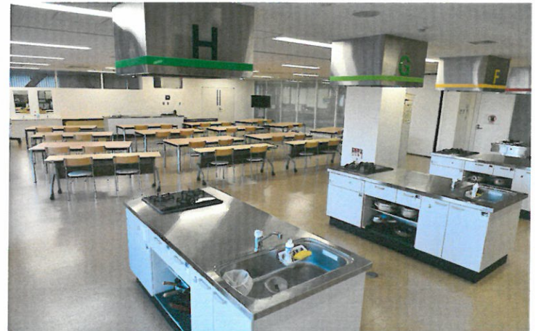
「京の食文化ミュージアム・あじわい館」教室風景